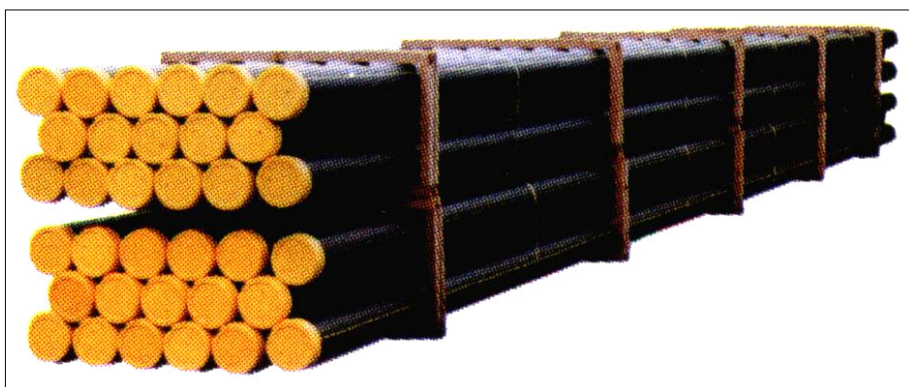
BARRE DA mt. 6 - 12