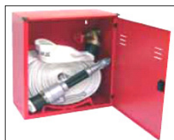
H 61 x L 55 x P 25 SPORTELLO PIENO COD. AD00F70