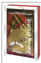
H 57 x L 36 x P 15 LASTRA SAFE CRASH COD. AD00145