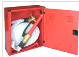
H 51 x L 40 x P 18 SPORTELLO PIENO COD. AD00F45