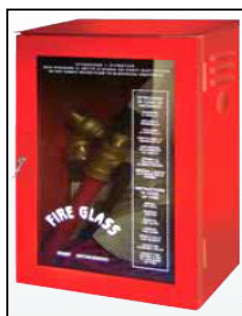
H 61 x L 37 x P 20 LASTRA SAFE CRASH