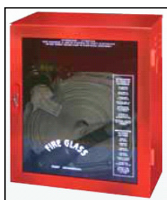
H 68 x L 50 x P 25 LASTRA SAFE CRASH