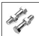
BULLONI + DADI TESTA ESAGONALE ZINCATI 8.8 UNI5737